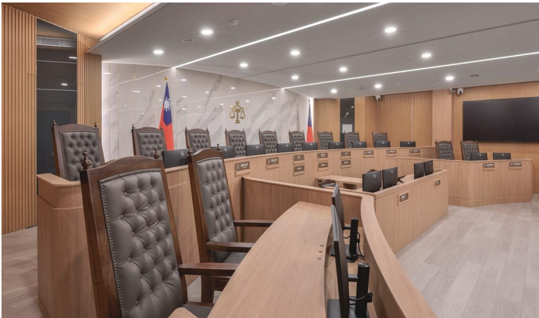
南投地院國民法官法庭/司法院提供