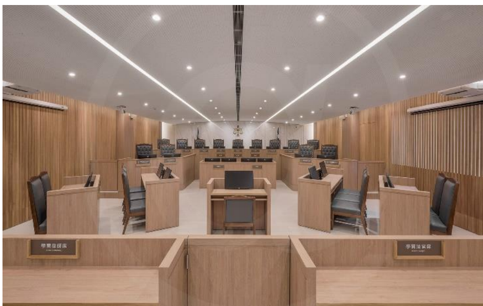
新北地院國民法官法庭

司法院表示，國民法官法庭設計以白色、木質調為基底，象徵公開透明、溫暖且富有人性；而法庭空間與以多元運用原則規劃的選任會場、詢問室、評議室、休息室、專用動線及安全通道等關連場域，設計時都顧慮到使用者的隱私、便利與安全性，且配備「無障礙設施」，希望能使每一位參與審判的國民感到友善、可親，實現國民法官制度多元、同理及包容的精神。