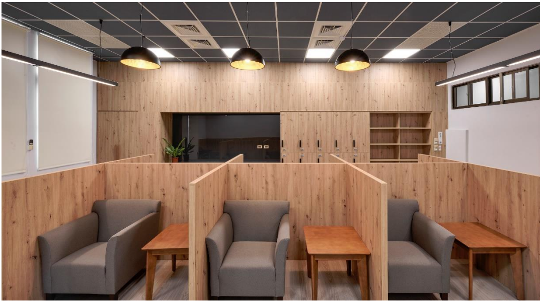
南投地院國民法官休息室