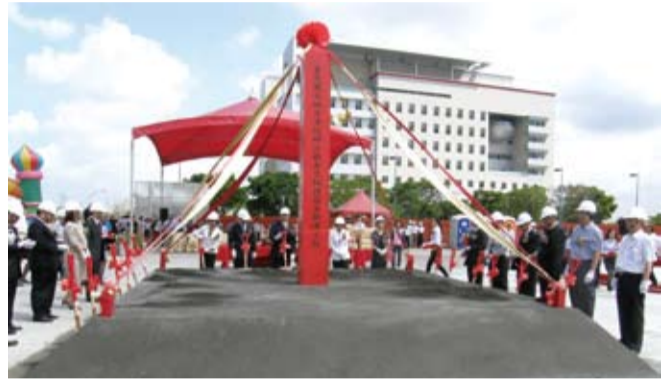
鳳山地院奠基典禮儀式中，司法首長及各界嘉賓分列於旁觀禮。

【本刊高雄訊】臺灣高雄地方法院籌建之鳳山地方法院，於4月24日舉行動土奠基典禮，司法院賴浩敏院長親臨主持，臺高院陳宗鎮院長、高雄分院黃金石院長、高雄高等行政法院張瓊文院長、高雄地院高金枝院長、高雄少年法院王光照院長及高雄地檢署蔡瑞宗檢察長、高雄市政府劉世芳副市長、法律扶助基金會高雄分會謝慶輝會長、高雄律師公會盧世欽常務理事、國立高雄大學黃英忠校長等各界來賓觀禮。